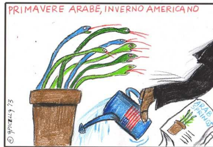
Arabské jaro, americká zima

Ujišťujeme vás soudruzi, že na této cestě, která je nesnadná a náročná, bude KKE na vaší straně!