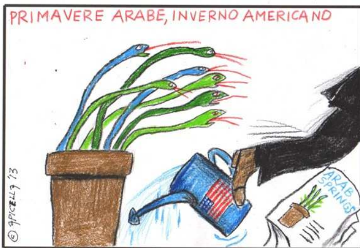
Arabské jaro, americká zima

Ujišťujeme vás soudruzi, že na této cestě, která je nesnadná a náročná, bude KKE na vaší straně!