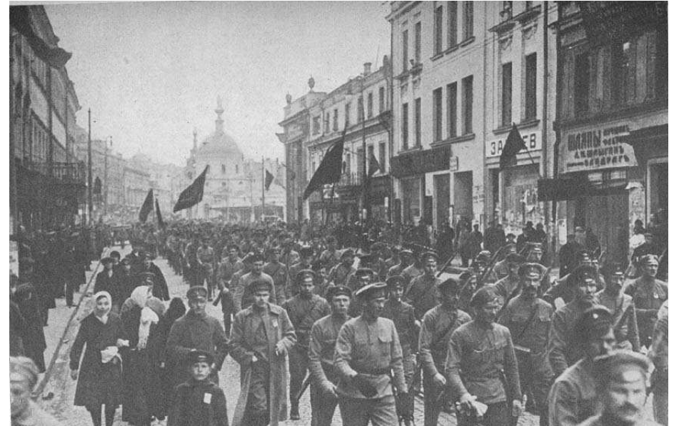
Manifestace bolševických vojáků

Menševici a eseri svolali 12. září 1917 všeruskou demokratickou poradou, na které byl ustaven předparlament (Prozatímní rada republiky). Byl to však beznadějný pokus politických bankrotářů obrátit kolo revoluce zpět. Ústřední výbor bolševické strany se usnesl předparlament bojkotovat.