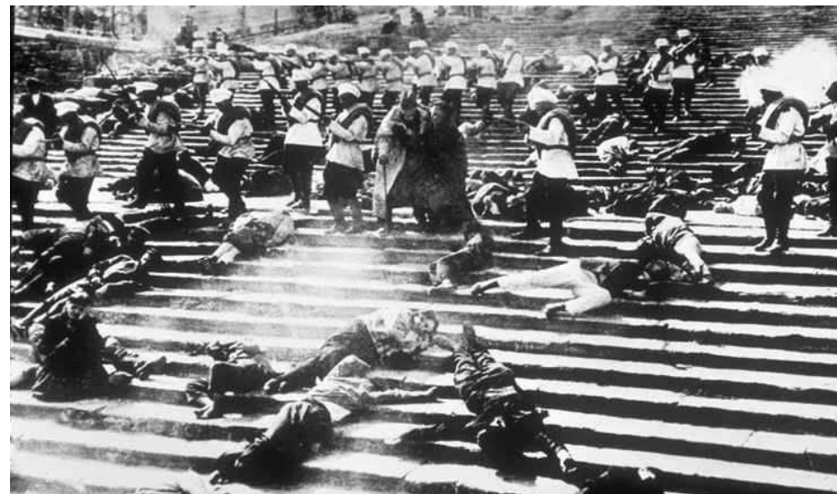
Rozehnutí demonstrace armádou

Carská vláda se v boji proti revoluci neomezovala jen na represivní opatření, ale rozhodla se zasadit revoluci další ránu svoláním nové „zákonodárné“ dумы. Počítala, že svoláním takové dумы odradí od revoluce rolnictvo. V prosinci 1905 vydala zákon o svolání nové „zákonodárné“ dумы. Carský volební řád byl ovšem protidemokratický.