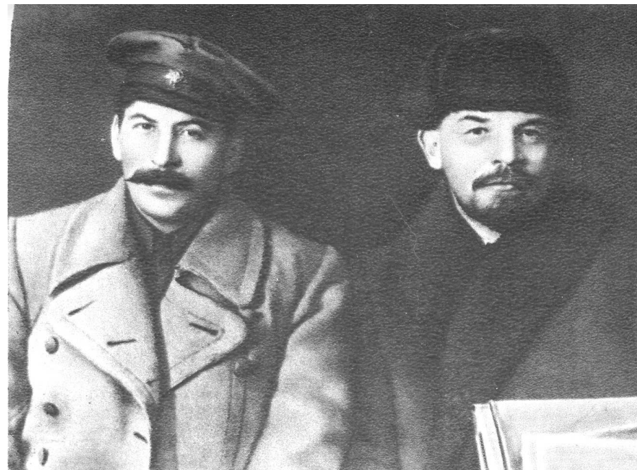
Stalin a Lenin

Hned první dny války potvrdily, že Lenin měl pravdu. 4. srpna 1914 hlasovala německá sociální demokracie v říšském sněmu pro válečné úvěry. Stejně se zachovala