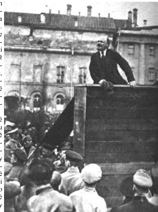
Leninův projev na demonstraci

Organizace bolševické strany, které za carismu pracovaly nelegálně v nejtěžších poměrech, vystoupily po únorové revoluci z ilegality a přikročily k otevřené politické a organizační činnosti. Bolševické organizace měly tehdy asi 40 000 až 45 000 členů. To však byly kádry zocelené v boji. Výbory strany byly zreorganizovány podle zásady demokratického centralismu. Bylo stanoveno, že všechny orgány strany, od nejnižších až po nejvyšší, musí být voleny.