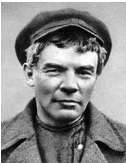
Leninova podoba v ilegaltě

VI. sjezd strany zaměřil stranu na ozbrojené povstání, na socialistickou revoluci.