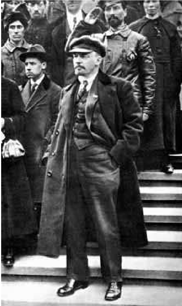
Lenin na Rudém náměstí v Moskvě

Německá vláda přerušila příměří a zahájila ofenzivu. Avšak vojenská intervence německých imperialistů vyvolala mohutné revoluční nadšení v zemi. Na zvolání strany a sovětské vlády: „Socialistická vlast je v nebezpečí!“ odpověděla dělnická třída urychleným tvořením oddílů Rudé armády. 23. února, den odražení armád německého imperialismu, se stal dnem zrodu Rudé armády.