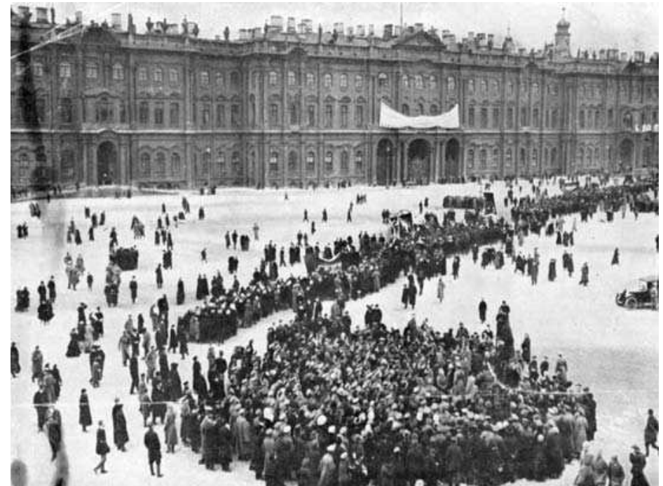
Manifestace před carovým palácem v Petrohradě

Bolševici ustavovali buňky v armádě a v námořnictvu, na frontě i v posádkách v zázemí a rozšiřovali letáky s výzvami proti válce. Na frontě agitovala strana pro sblížení vojáků válčících armád.