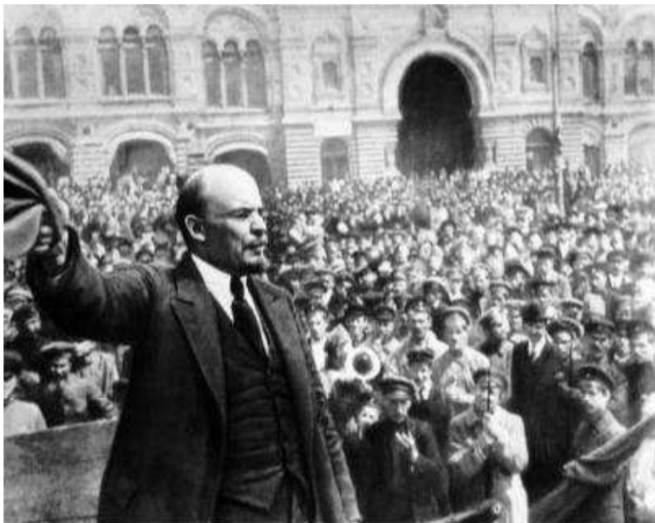
Lenin na revolučním shromáždění

Sovětská revoluce se v době od října 1917 do ledna – února 1918 rozšířila po celé