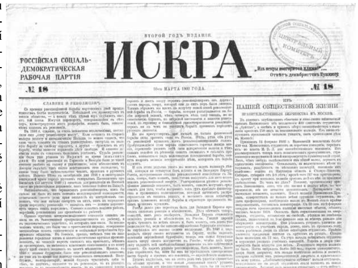
Bolševické noviny „Jiskra“

Na Západě v té době mezi sociální demokracií začal stále více sílit oportunistický proud, vystupující pod heslem „svobody kritiky“