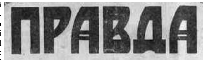
Bolševické noviny „Pravda“

Mocnou zbraní v rukou bolševické strany při upevňování jejich organizací a získávání vlivu mezi masami byl bolševický deník „ Pravda “ vycházející v Petrohradě. Časopis