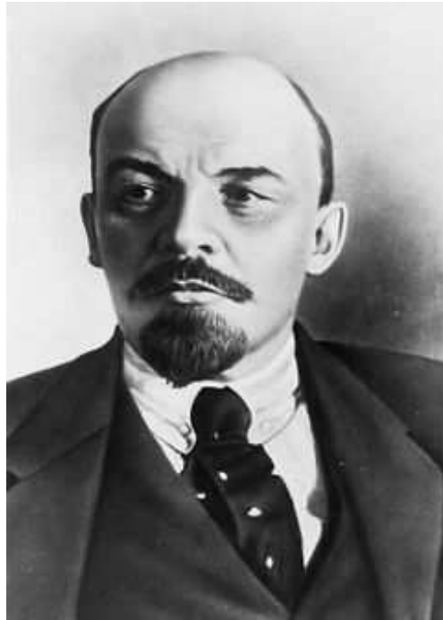
Vůdce bolševiků Lenin

Koncem XIX. století nastala v Evropě průmyslová krize, která brzy zasáhla také Rusko. Průmyslovou krizí a nezaměstnaností dělnické hnutí zastaveno a ochromeno